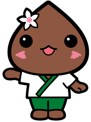
幌加内町マスコットキャラクター「ほろみん」