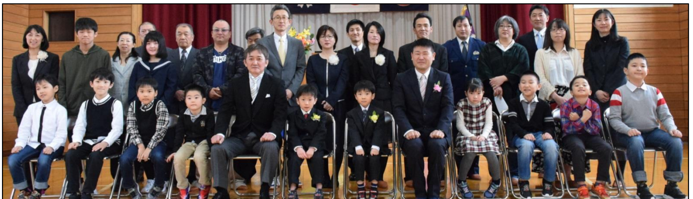
朱鞠内小学校らしさを感じる1枚（平成31年度入学式）

次回も、多くの皆様にご参観いただけたら子どもたちの励みになります。よろしくお願いいたします。